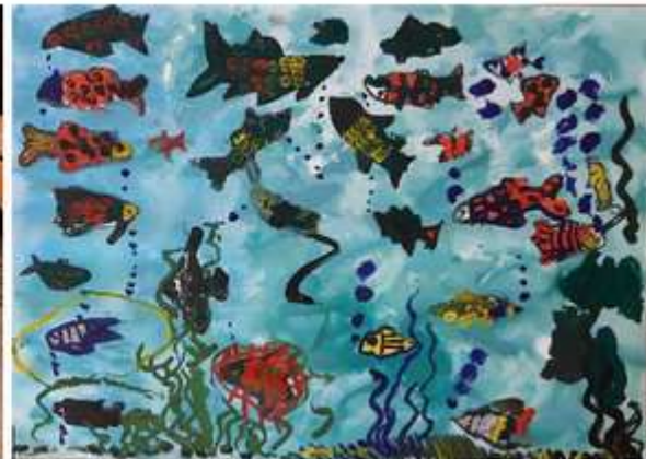
2 pav. Akvariumo tapymas naudojant dažus su purkštukais. Nuėmus žuvų trafaretus, žuvys tapomos teptukais, apvedžiojant, brūkšniuojant, taškuojant.