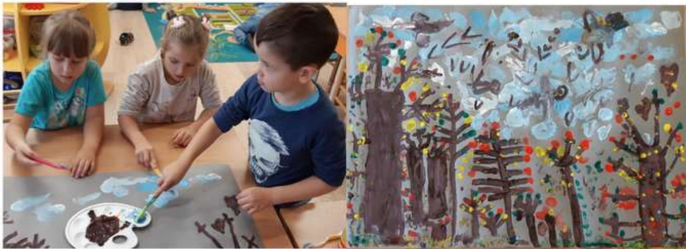
4 pav. Tapymas šepetukais, teptukais ir pirštukais, bendras vaikų kūrybinis darbas ant A1 formato lapo.