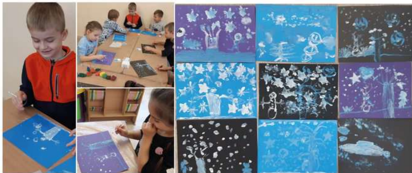
5 pav. Tapymas vatos pagaliukais ant spalvoto popieriaus.