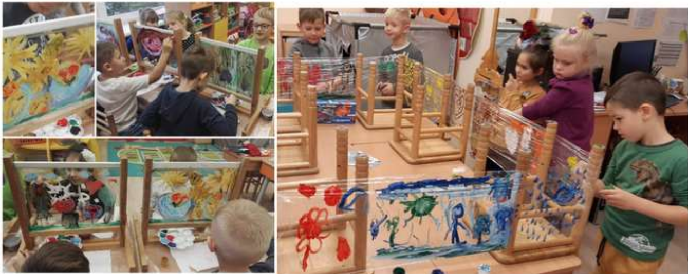
3 pav. Tapymas guašo dažais teptuku ant stiklo stovelių ir plėvelės.