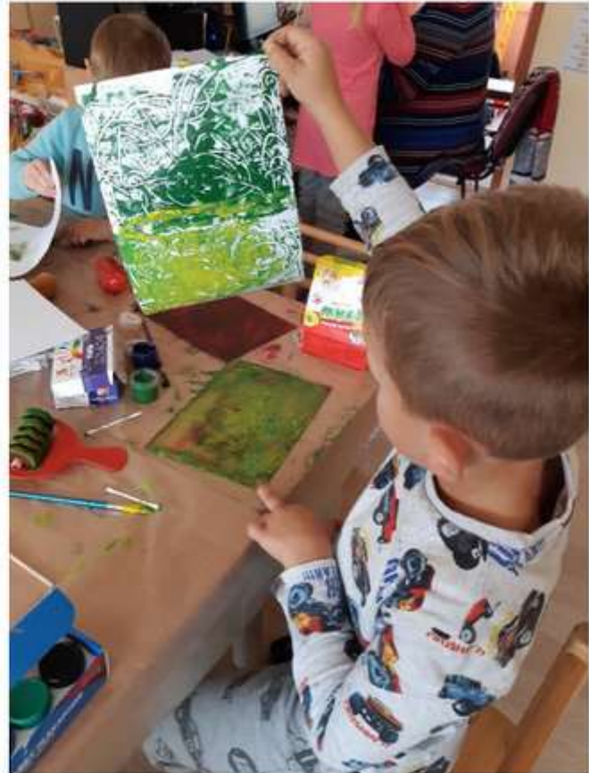
1 pav. Tapymas ant plastikinės lentelės, naudojant teptuką, volelį, objektų tapymas vatos pagaliukais, ir spaudas ant popieriaus (uždėjus popieriaus lapą ant išvoluoto dažais ir ištapyto su vatos pagaliuku vaizdo, lapas dar kartą užvoluojamas ir atkeliamas nuo plastiko lentelės).